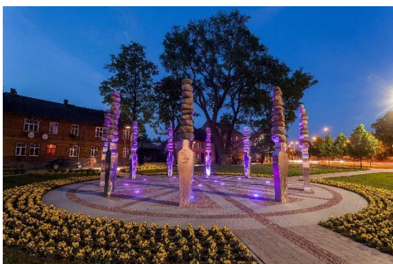
Vides objekts “Laika rats 100”.

Varbūt īpašu vietu, interesantu vēstures nianšu un personību atklāšana pēkšņi ļaus rast jaunus iedvesmas avotus arī turpmākiem ikdienas darbiem. Savukārt valsts svētku koncerta apmeklējums vai kādas jaunas tradīcijas ieviešana gada tumšo laiku vērtīs ģimeniski siltā, drošā un patīkamā noskaņā, cerīgi raugoties tuvo cilvēku un visas mūsu valsts nākotnē. Lai Zemgale ļauj atklāt mūsu Latviju no jauna!