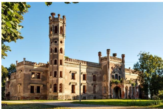
Odzienu muižas pils.

Liriskāk noskaņotie aicināti iepazīt Jāņa Jaunsudrabiņa personību un tā laika dzīves apstākļus rakstnieka muzejā “Riekstiņi” , kas iekārtots senas zemnieku sētas saimniecības ēkā un atspoguļo arī agrāko laiku tradīcijas un amatniecības prasmes Sēlijas novadā. Sētā saglabājusies Jaunsudrabiņa slavenajā “Baltajā grāmatā” attēlotā pasaule, pastaigu takas ved gar tajā minētajām vietām, bet pamatekspozīcija iepazīstina ar rakstnieka un gleznotāja dzīvi. Savukārt uz Odzienu jādodas tiem, kas skaistumu redz ne tikai vēstures cēlajās lappusēs, bet arī ikdienas tehnikā. Odzienu muižas pils ir viena no zīmīgākajām neogotikas stila celtnēm Latvijā, un arī tās apkārtnē apbur. Tikmēr blakus esošajā auto un tehnikas kolekcijā apskatāma citāda vēsture – vairāk nekā 20 padomju laika automašīnas, motocikli, fotoaparāti, radio aparāti, sadzīves tehnika un pat FORMULA “Estonia”.