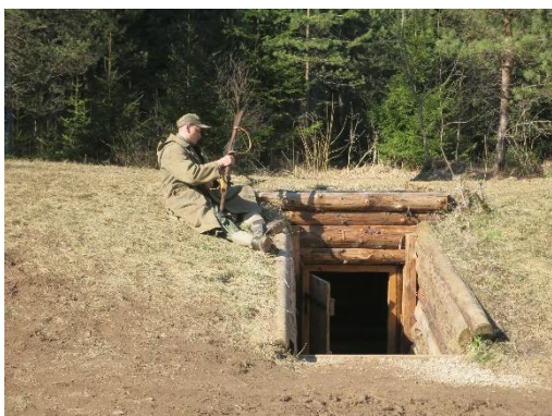
Īles bunkurs.

Vēl Dobeles pusē ir iespēja apmeklēt vairākas pils. Neogotikas stilā celtā Vecauces pils patlaban darbojas kā kultūras un tūrisma centrs. Te gida pavadībā var gan izstaigāt telpas, gan uzzināt vairāk par muižas vēsturi, ar to saistītajām leģendām un arī mācību un pētījumu saimniecību "Vecauce", kas saimnieko muižas zemēs jau kopš 1921. gada. Savukārt Dobeles pils šogad sarūpējusi īpašu programmu tieši patriotu nedēļai . 16. novembrī plkst. 17 gan lieli, gan mazi pils muzejā varēs vairāk uzzināt par Latvijas brīvības cīņām, kā arī piedalīties radošajās darbnīcās un aktivitātēs. Nodibinājuma "Latviešu strēlnieki Ķemeru purvos" pārstāvji ne tikai stāstīs par Latvijas brīvības cīņu norisi, bet arī demonstrēs dažādus priekšmetus no cīņu vietām un piedāvās praktisku darbošanos ikvienam interesentam.