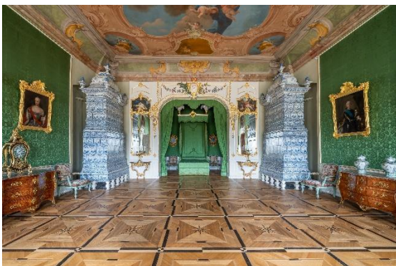
Rundāles pils muzejs, hercoga istaba.

Rundāles pils muzeja piedāvājumu vislabāk ir baudīt tieši tagad, kad te nav tūristu pūļu un netraucēti var iegrimt mākslas vēstures pētīšanā un izzināšanā. Tāpat sava burvība ir Bauskas pils muzeja apskatei, daļībai senā dzīvesveida darbnīcās vai kāda koncerta apmeklējumam. Taču daudziem par vēl neatklātu iedvesmas vietu var kļūt kultūrtelpa “Mežotnes baznīca” , kura ir atjaunota praktiski no drupām. Te ierīkota ekspozīcija par seno Mežotnes pilskalnu, kas savulaik bija vērienīgākais un nozīmīgākais pilskalns Zemgalē, bet netālu no tās ir arī Līvenu dzimtas kapi . Tieši šī dzimta devusi lielu ieguldījumu valsts atjaunošanā un novada attīstībā – tās laikā uzcelta Mazmežotnes muiža un Ķieģeļu ceplis, kuru šobrīd par tūrisma un kultūras objektu attīsta Igo kūrētais mūzikas un mākslas centrs “Ceplis”. Savukārt kino cienītājiem būs interesanti apmeklēt atpūtas kompleksu “Miķelis”, kur Zemnieku sētas muzejā tika uzņemta filma “Dvēseļu putenis” . Tāpat te apskatāma lielākā privātā retro auto kolekcija Baltijā.