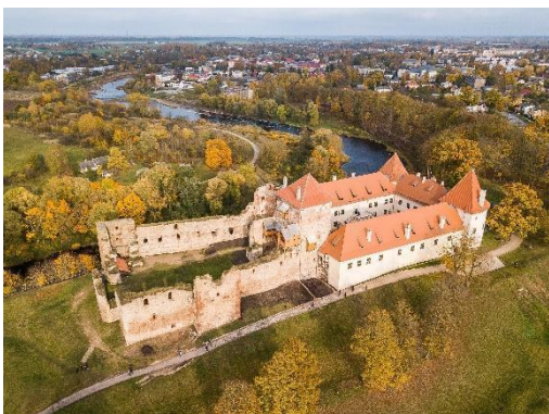
Bauskas pils.