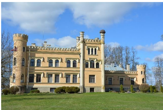
Gārsenes pils.