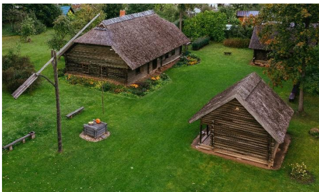
“Sēļu sēta”.